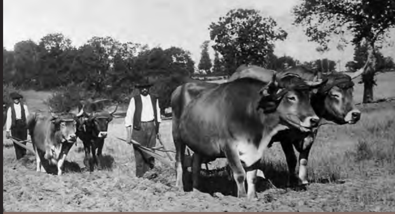
histoire / patrimoine