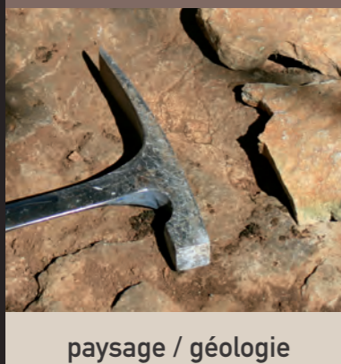
paysage / géologie