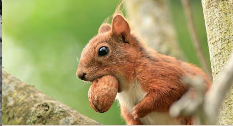
faune / flore